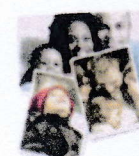
Photos, dessins d'enfants