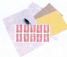
Nécessaire de courrier

Emballer les aliments dans des boîtes en plastique transparent ou des sachets plastiques (type sachets de congélation) fermés avec des élastiques ou des liens sans métal